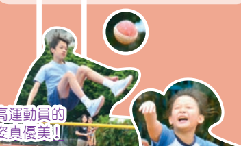
跳高運動員的英姿真優美！