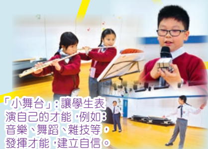
「小舞台」：讓學生表演自己的才能，例如：音樂、舞蹈、雜技等，發揮才能，建立自信。