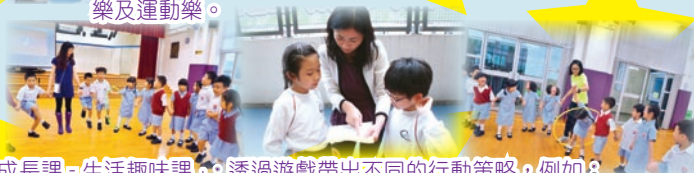
「德育及成長課-生活趣味課」：透過遊戲帶出不同的行動策略，例如：持久專注、堅持達標等，同時促進師生及生生互動，學習互相理解、體諒及團結的精神，加強師生的班本凝聚力，享受遊戲的樂趣。