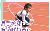
小小健兒身手敏捷，一下子就穿過呼拉圈，衝向終點。