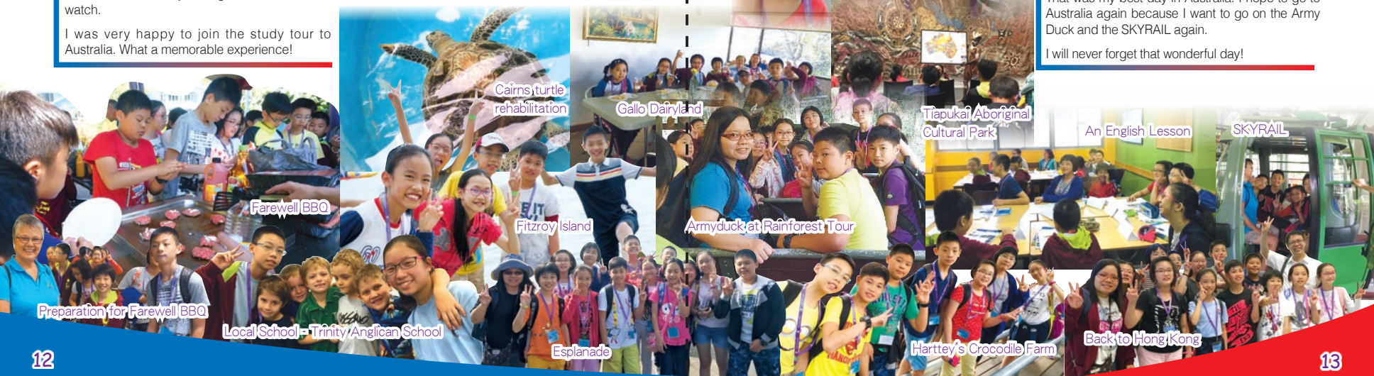
Local School - Trinity Anglican School