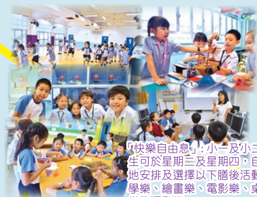
「快樂自由息」：小一及小二學生可於星期三及星期四，自主地安排及選擇以下膳後活動：數學樂、繪畫樂、電影樂、桌遊樂及運動樂。