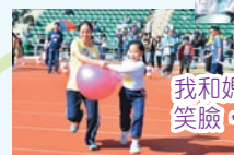
我和媽媽抱着球，帶着笑臉，享受運動的樂趣。