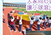
色彩繽紛的快樂傘變成小蘑菇，真可愛！