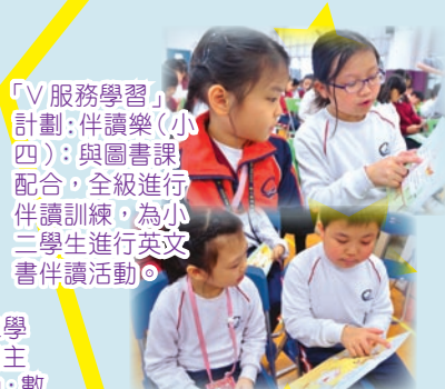
「V服務學習」計劃：伴讀樂（小四）：與圖書課配合，全級進行伴讀訓練，為小二學生進行英文書伴讀活動。