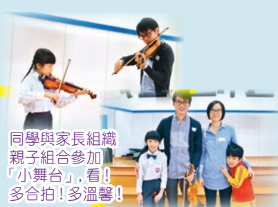
同學與家長組織親子組合參加「小舞台」，看！多合拍！多溫馨！